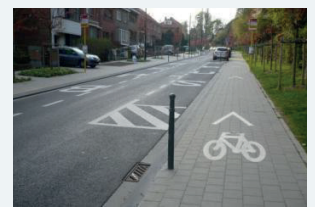
Exemples d'aménagement de voies de circulation douce