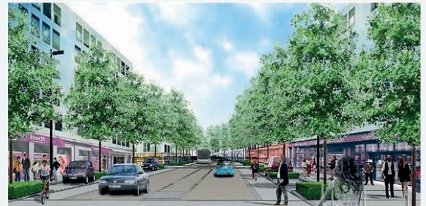
Exemples d'aménagement en boulevard urbain