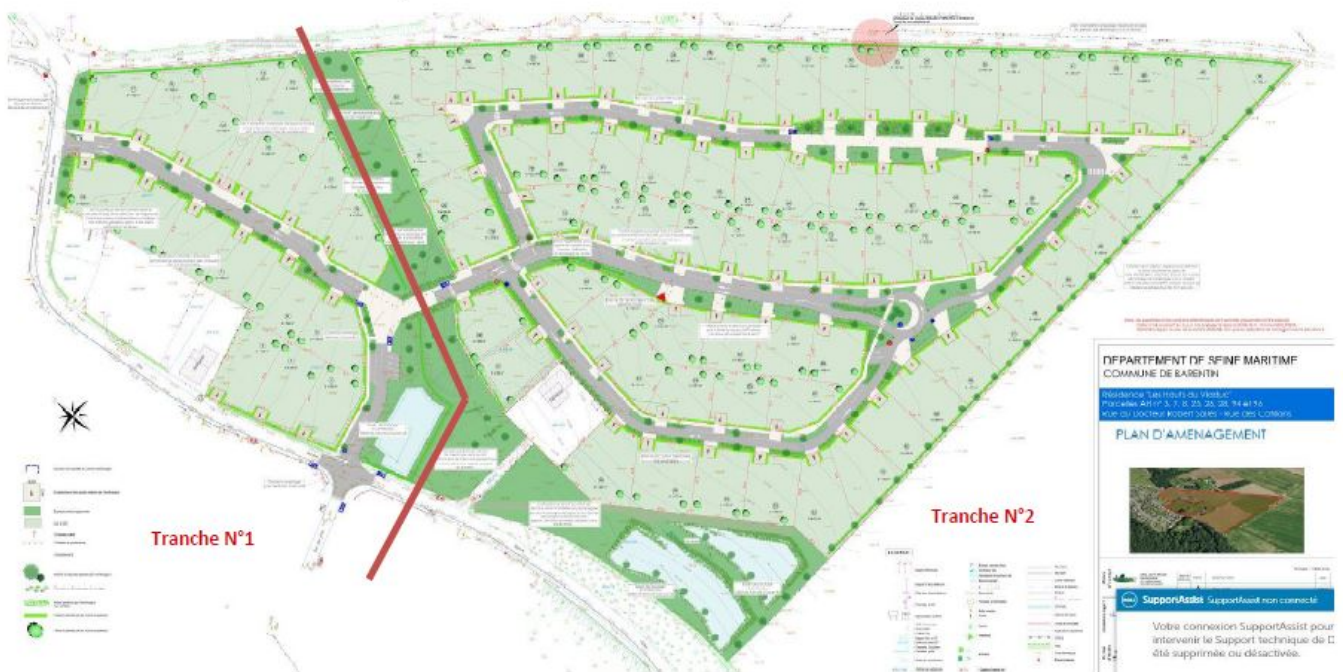
Plan d'aménagement

Le lotissement correspond à l'ensemble identifié au PLU par une orientation d'aménagement et de programmation (OAP). Une première tranche a été réalisée sur 1,68 ha pour 17 maisons individuelles. La tranche 2 du projet comprend 72 lots à bâtir d'une superficie moyenne de 600 m 2 chacun, un lot de voirie et d'équipements communs et un lot pour les bassins et espaces verts.