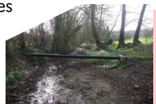
La Clérette sécheresse 2017

A ménager et développer durablement les territoires en intégrant la prévention des risques naturels et technologiques