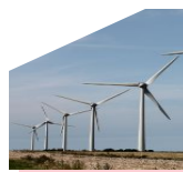
Parc éolien à Fécamp

I mpulser des dynamiques et accompagner les territoires dans les transitions en plaçant la transition écologique au cœur des projets de territoire