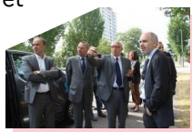
visite quartiers NPNRU de la Métropole

F avoriser la cohésion sociale territoriale et améliorer le cadre et qualité de vie en croisant les politiques de l'urbanisme, de rénovation urbaine et d'accès au logement