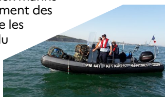
Opération nettoyage de l'environnement marin par l'ULAM

P réservier le littoral et les milieux marins notamment via l'accompagnement des transitions auxquelles font face les acteurs maritimes, la gestion du domaine public maritime et le contrôle des pêches