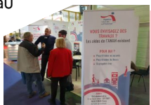
L'Agence Nationale de l'Habitat au Salon Maison Déco 2018

D évelopper et valoriser l'analyse territoriale pour une meilleure connaissance des enjeux du territoire et coordonner les acteurs de l'aménagement