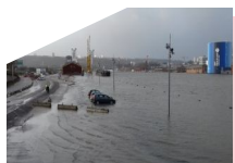
Crues quais de Seine Rouen 2018