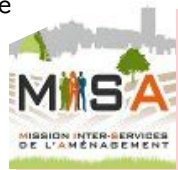
Mission d'accompagnement et de coordination des porteurs de projets

D évelopper et valoriser l'analyse territoriale pour une meilleure connaissance des enjeux du territoire et coordonner les acteurs de l'aménagement