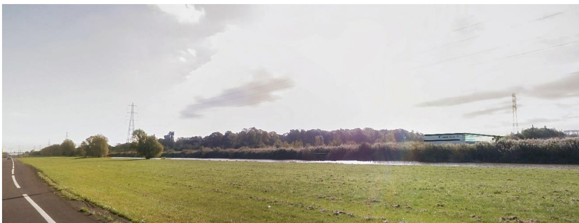
Vue depuis la route industrielle angle de site Nord-Ouest