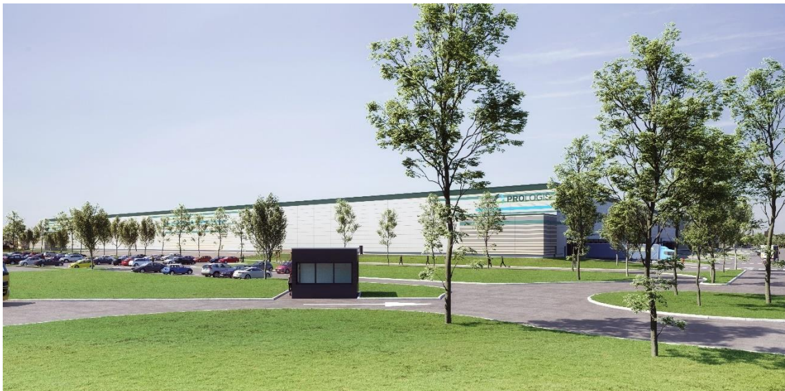
Vue depuis l'accès principal angle entrée de site Sud-Ouest