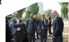
visite quartiers NPNRU de la Métropole

D évelopper et valoriser l'analyse territoriale pour une meilleure connaissance des enjeux du territoire et coordonner les acteurs de l'aménagement