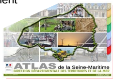
Atlas cartographique 2019

D évelopper et valoriser l'analyse territoriale pour une meilleure connaissance des enjeux du territoire et coordonner les acteurs de l'aménagement