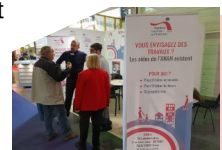
L'Agence Nationale de l'Habitat au Salon Maison Déco 2018

F avoriser la cohésion sociale territoriale et améliorer le cadre et qualité de vie en croisant les politiques de l'urbanisme, de rénovation urbaine et d'accès au logement