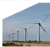
Parc éolien à Fécamp

I mpulser des dynamiques et accompagner les territoires dans les transitions en plaçant la transition écologique au cœur des projets de territoire