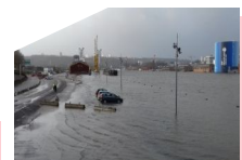
Crues quais de Seine Rouen 2018