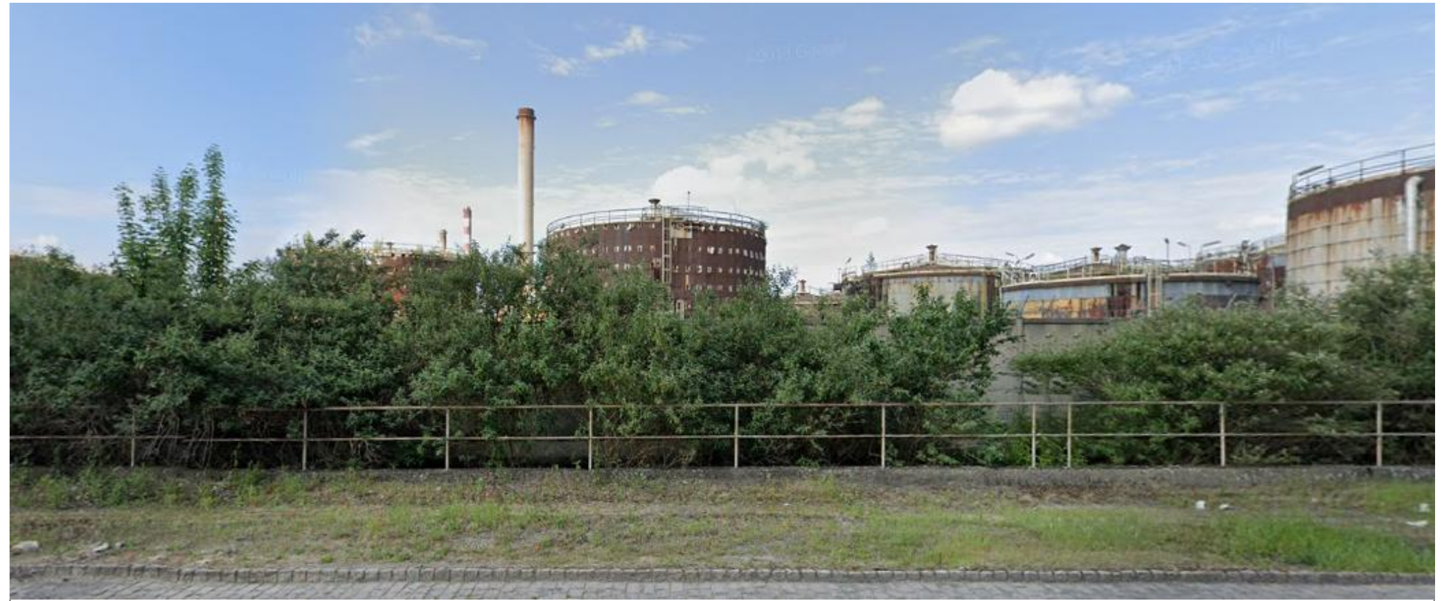
VUE PROCHE 1 (VP 1)