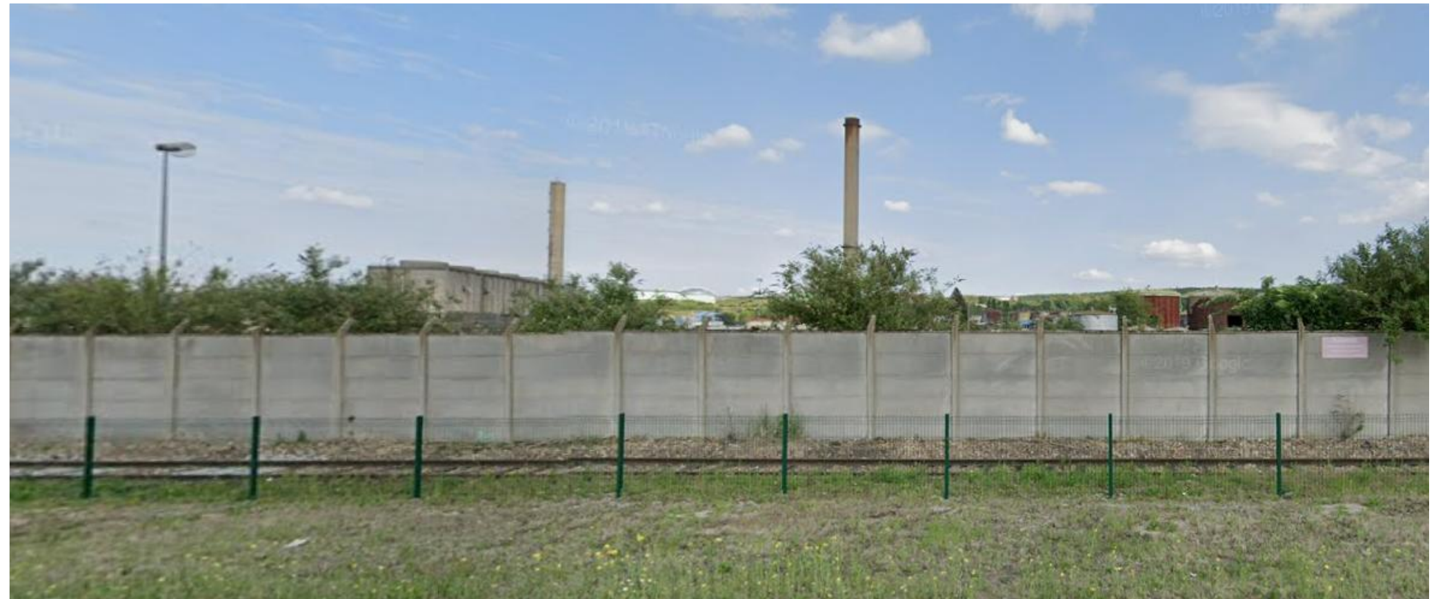
VUE PROCHE 2 (VP 2)