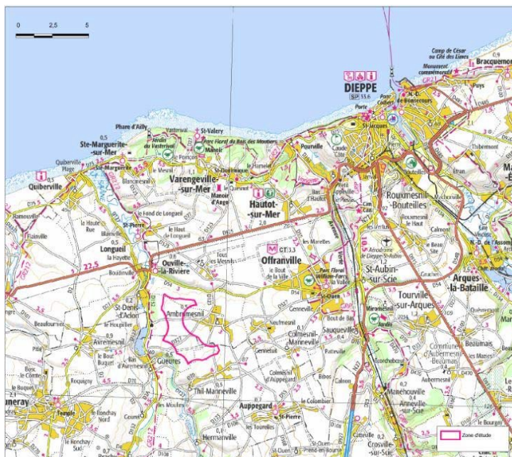
Illustration 1: plan de localisation extrait de l'étude d'impact

Le projet porté par la société SAS Parc éolien du Pays de Caux consiste en l'implantation et l'exploitation de trois éoliennes et d'un poste de livraison électrique sur la commune d'Ambrumesnil, située à une dizaine de kilomètres au sud-ouest de Dieppe.