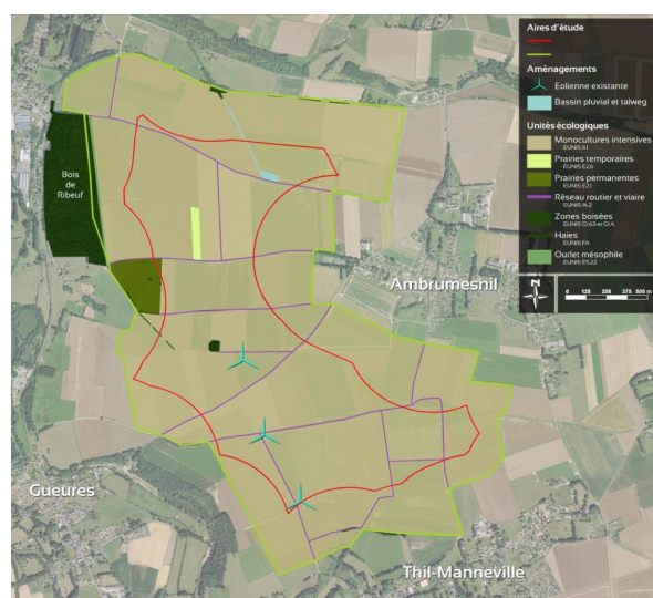
Illustration 2: plan présentant la zone d'implantation potentielle (ZIP), qui constitue « l'aire d'étude immédiate » de l'étude d'impact. Ce plan permet de localiser les trois éoliennes du parc éolien de Gueures déjà en exploitation.

Le projet d'implantation est localisé dans le département de Seine-Maritime, sur la commune d'Ambrumesnil. La zone d'implantation potentielle (ZIP) est la zone du projet en l'absence de contraintes réglementaires (éloignement de 500m des zones destinées à l'habitation dans le document d'urbanisme) et déterminée par des critères techniques (gisements de vent notamment). Elle constitue l'aire d'étude immédiate de l'étude d'impact. La ZIP est limitée au secteur de plateau, excluant la vallée de Tessy. Elle se situe donc sur un plateau occupé par de vastes monocultures d'agriculture intensive, caractéristiques des plateaux agricoles du Pays de Caux. Elle intègre également le parc éolien existant de Gueures dans la perspective d'évaluer les impacts cumulés.