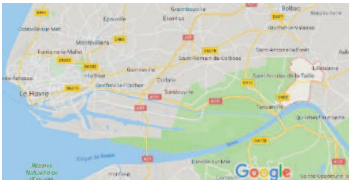
Illustration 1: Plan de localisation